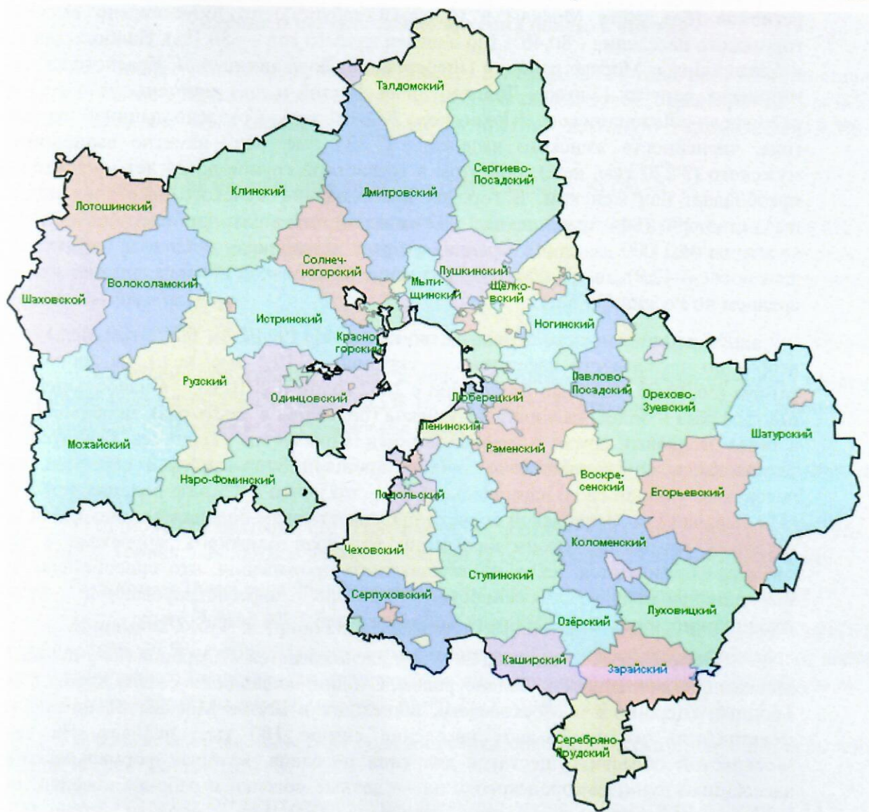
Рисунок 8-1 Схема Московской области

В Московской области наблюдается устойчивый рост населения (так, с 2005 года по 2012 прирост составил 10,5%). Смертность в Московской области превышает рождаемость, однако в последние годы естественная убыль населения снижается (с – 8,5% в 2005 году до – 2,4% в 2012 году). Прирост населения в области идёт главным образом за счёт увеличения числа жителей городов — такая тенденция отмечается с 1970-х годов; в городах или посёлках городского типа живёт и подавляющее большинство населения — свыше 80%. Общий рост населения обеспечивается за счёт внешних миграций. Из общего числа прибывших в Московскую область в 2006—2010 годах около 22% составляли иностранные граждане, причём число иностранных граждан растёт. В 2010 году численность иностранных работников составляла 230,7 тыс. чел. — в 1,6 раз больше, чем в 2005 году. Особенностью Московской области является значительный объём маятниковых миграций рабочей силы. Значительная часть экономически активного населения Московской области трудоустроивается в Москве. По абсолютным значениям численности населения в 2010 году лидировали Одинцовский (316,6 тыс.чел.), Раменский (256,3 тыс.чел.), Сергиево-Посадский (225,3 тыс.чел.) и Балашихинский (225,3 тыс.чел.) районы.